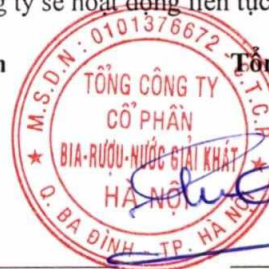
Ngô Quốc Lâm